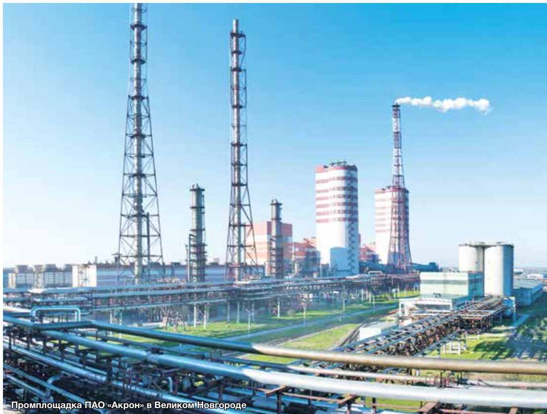
Промплощадка ПАО «Акрон» в Великом Новгороде

Любая выставка – очень важное и ответственное событие. Поэтому многие компании стараются провести ряд важных мероприятий именно в это время. «Золотая осень» не стала исключением. Группа «Акрон», входящая в десятку крупнейших мировых производителей сложных минеральных удобрений, приурочила к выставке подписание соглашения о строительстве в Смоленской области нового производственного комплекса.