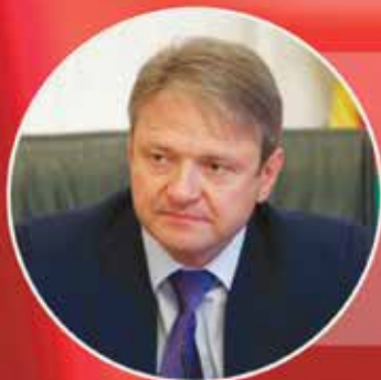
Александр Ткачев министр сельского хозяйства РФ